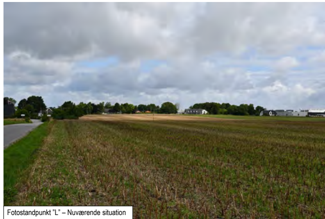
Fotostandpunkt "L" – Nuværende situation