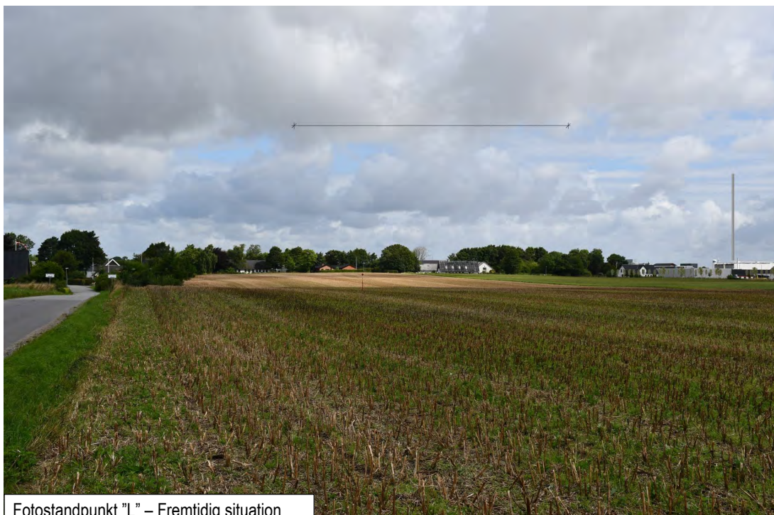
Fotostandpunkt "L" – Fremtidig situation

For at bibeholde en grøn ankomst til St. Lihme, friholdes der et areal, der i planlægningen udlægges som