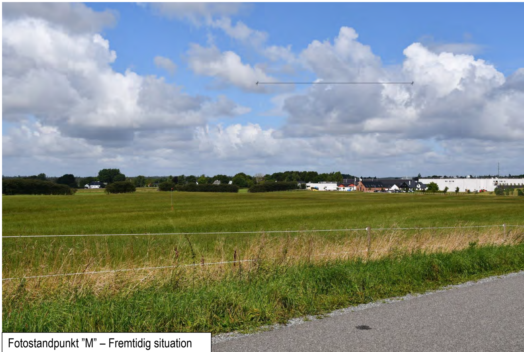
Fotostandpunkt "M" – Fremtidig situation