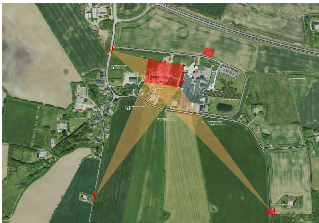
Figuren viser: De tre visualiseringsstandpunkter (L, M og N). De røde firkanter viser forventet udstrækning af de nye bygninger (se bilag C).

Planområdet er i dag en eksisterende gård, med landbrugsarealer omkring. Landbrugsarealerne gennemskæres af den eksisterende adgangsvej til slagteriet.