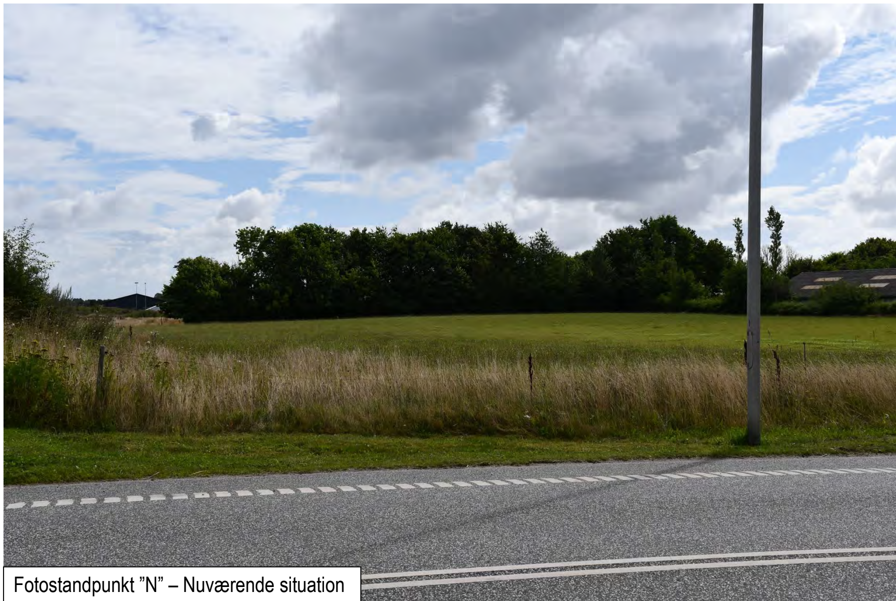
Fotostandpunkt "N" – Nuværende situation