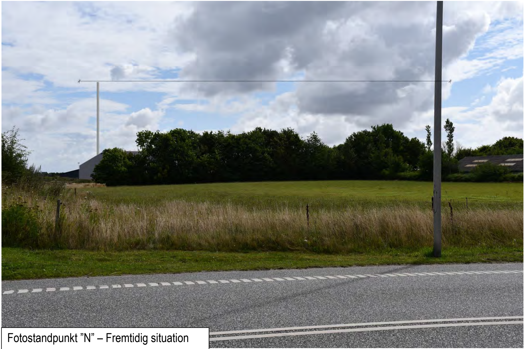
Fotostandpunkt "N" – Fremtidig situation