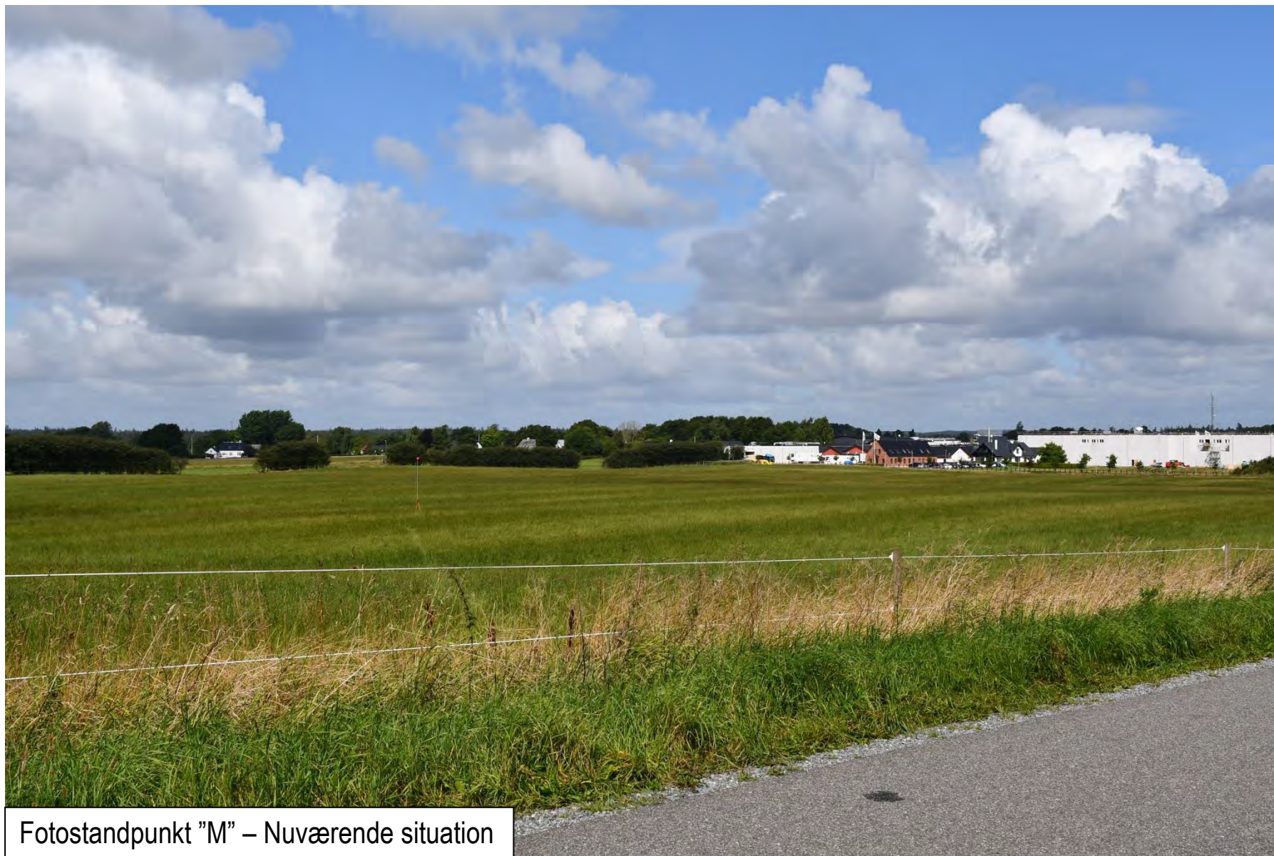
Fotostandpunkt "M" – Nuværende situation