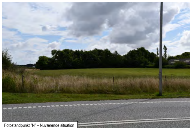
Fotostandpunkt "N" – Nuværende situation

Billederne viser hvordan der ser ud i området i dag. Billederne kan ses i stort format i bilag C.