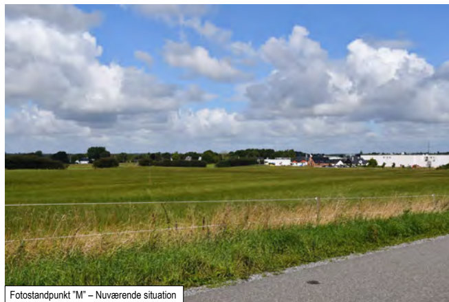
Fotostandpunkt "M" – Nuværende situation